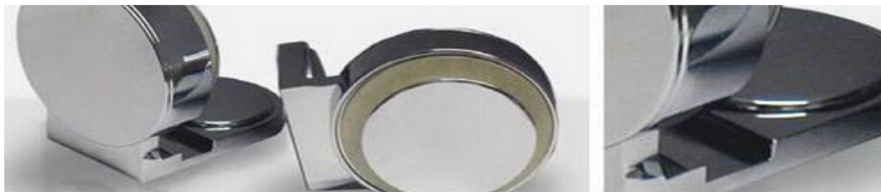
Winkel Glas/Wand 90° VarionPlus innen (Schraubsystem)